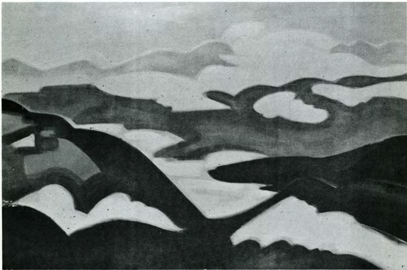
Le lac de St-Cassien