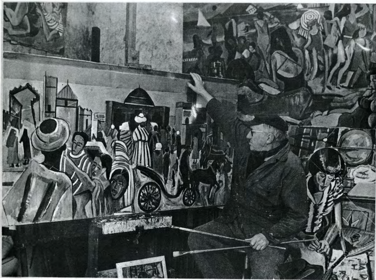
Hommage à Matisse (Marrakech)